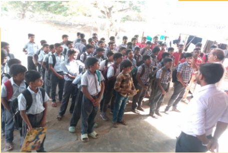
Boys Hostel Coimbatore