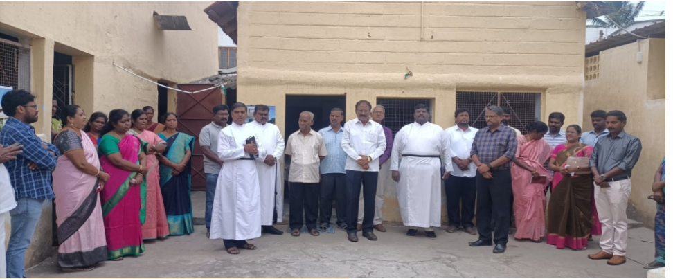
New School Building Work Started in CSI Nursery & Primary School, Rathinapuri