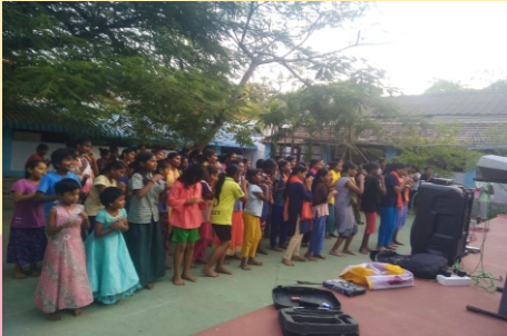
Girls Hostel Coimbatore