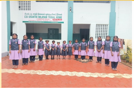
Shanthy Nilayam Padanthurai