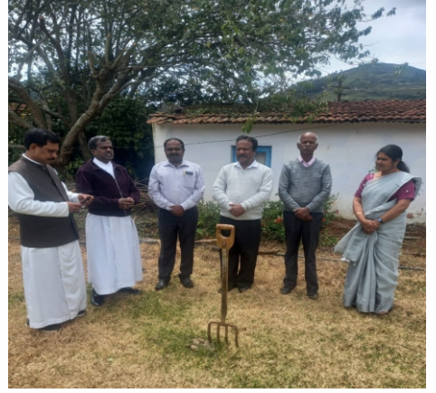
New Classroom Work & Fencing work Started in CSI Hr Sec School, Ketti